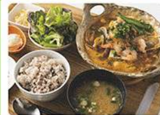
海鮮スンドゥブ定食 1,480yen