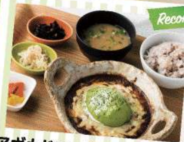
アボカドモッツアレラチーズ ハンバーグ定食 1,480yen