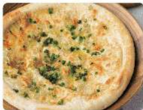
釜揚げシラスの ピッツア 1,080yen