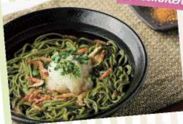
桜エビおろしそば 780yen