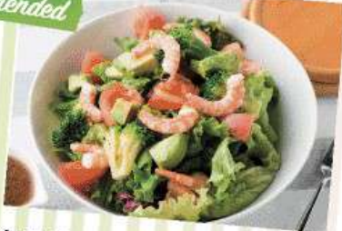
海老とアボカドのサラダ 980yen