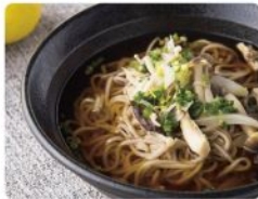
柚子きのこ 蕎麦 880yen