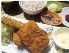
エビカニ ミックス定食 1,680yen