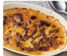
ミートソース ドリア 1,180yen